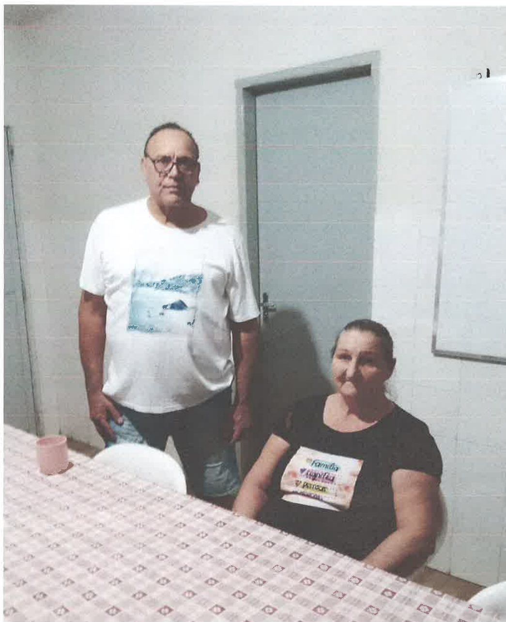
FOTO ALBERGUE NOTURNO JOSÉ PEREIRA DA SILVA PRADO PROGRAMA DE ATENDIMENTO AO ITINERANTE