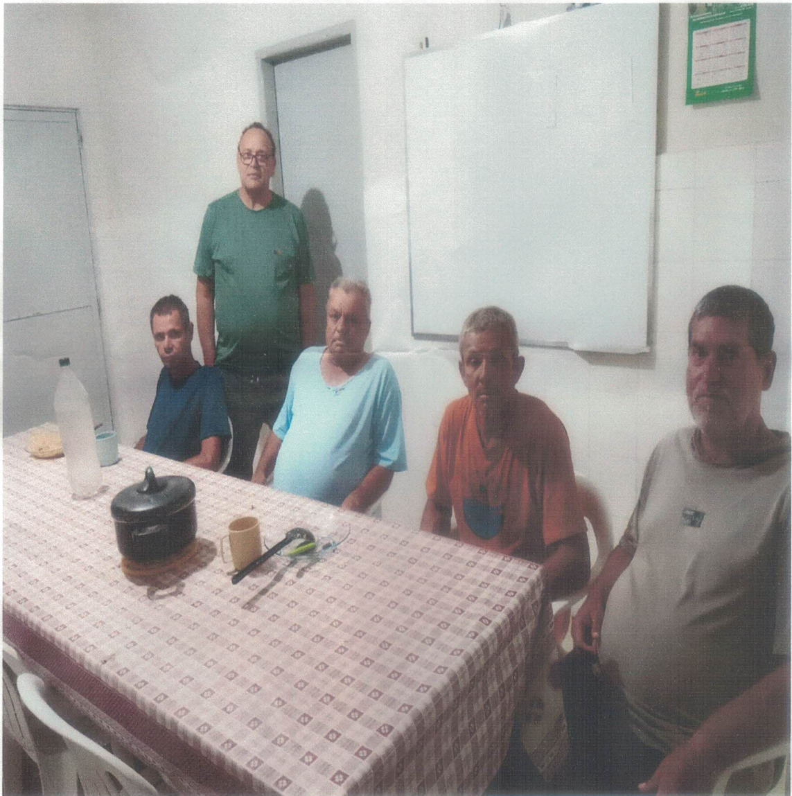
FOTO ALBERGUE NOTURNO JOSÉ PEREIRA DA SILVA PRADO PROGRAMA DE ATENDIMENTO AO ITINERANTE