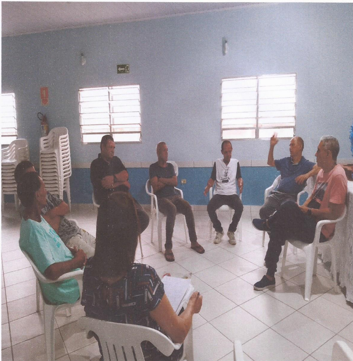
FOTO PROJETO CAFÉ DA MANHÃ NO ALBERGUE

ALBERGUE NOTURNO JOSÉ PEREIRA DA SILVA PRADO